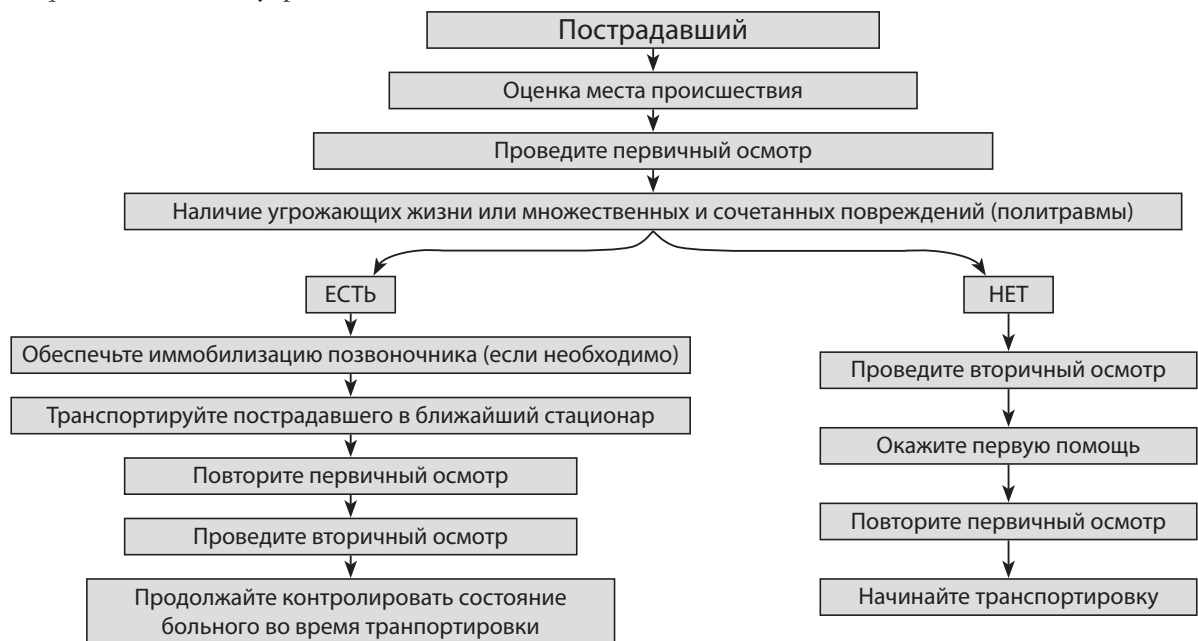
Рис. 2. Алгоритм оказания помощи на месте катастрофы на догоспитальном этапе.

* Первичный осмотр – четко установленный протокол обследования, основанный на мнемоническом правиле ABCDE, который позволяет быстро распознавать угрожающие жизни повреждения и определять приоритеты в лечении одновременно нескольких пострадавших. Сокращение: в/в – внутривенно.